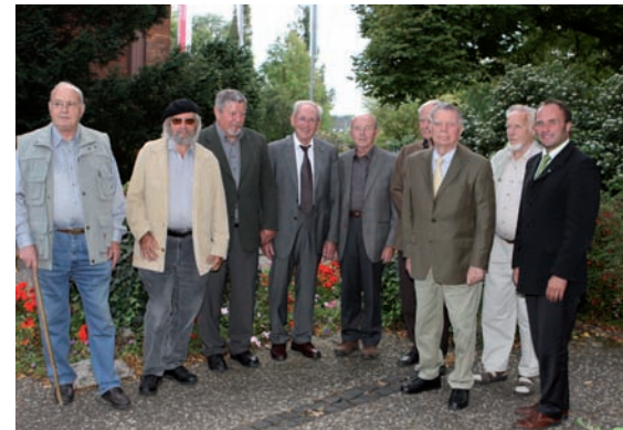
Ehrung für 40- und 50-jährige Mitgliedschaft im Geisenheimer Ehemaligen Verband

Im Rahmen der VEG-Mitgliederversammlung wurden am 9. September 2008 im Anschluss an die Betriebsleitertagung Weinbau und Kel-